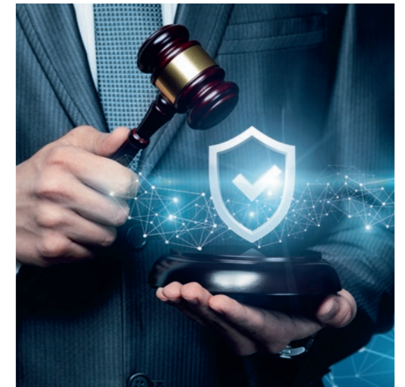
20 | Protection juridique Améliorations considérables des prestations pour les membres