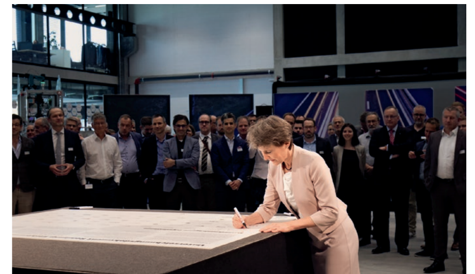
La conseillère fédérale Simonetta Sommaruga lors de la signature de la feuille de route sur la mobilité électrique 2025.

La nouvelle feuille de route sur la mobilité électrique a été signée le 16 mai 2022. Son objectif est d'augmenter la part des véhicules rechargeables, de créer davantage de bornes de recharge publiques et de rendre possible la recharge au service du réseau. EIT.swiss est également au départ avec une mesure.