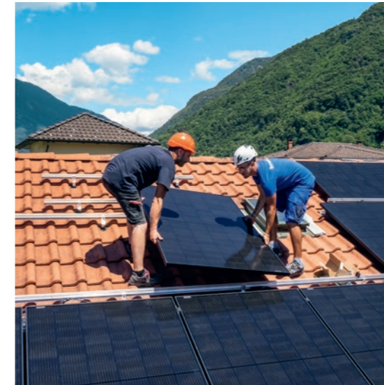
06 | Photovoltaïque Un domaine d'activité rentable pour l'installateur-électricien