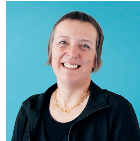
12 | Nouveau Comité Pour la première fois une femme au Comité d'EIT.swiss